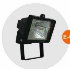
E-05 泛光燈 (小太陽) Halogen floodlight 500W