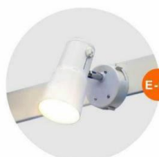
E-01 射燈 (白色) Spotlight (White) 23W