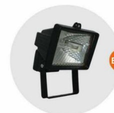
E-04 泛光燈 (小太陽) Halogen floodlight 300W