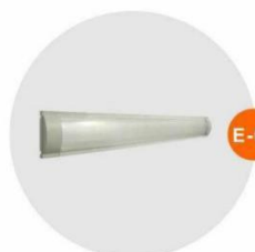
E-03 光管 Fluorescent Tube 28W