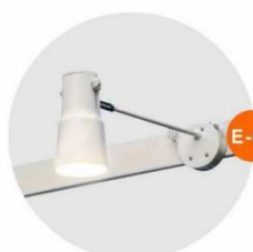
E-02 長臂射燈 (白色) Long-arm Spotlight (White) 23W