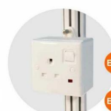
E-12 插座 (不能用於照明用電) Single Phase Socket (for machine only) 1000W(220V)