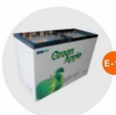
E-11 座地冷凍冰箱 (-18度)(不包括電插座) Sitting Style Refrigerator (-18°C, Excluding Socket) 1.2