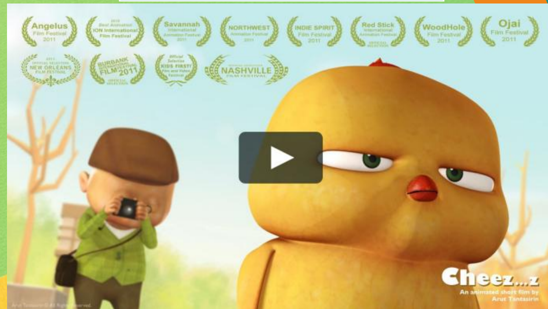
Warbie卡通短片获得全球多个大奖