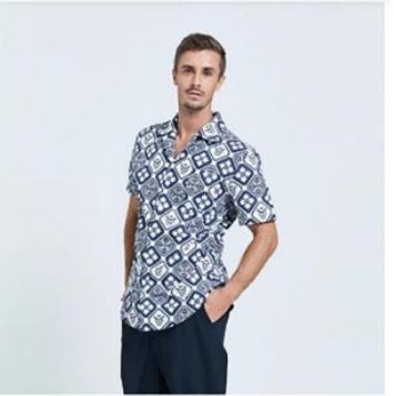
捲毛力卡聯名 古巴領短版棉質襯衫 (不列顛)