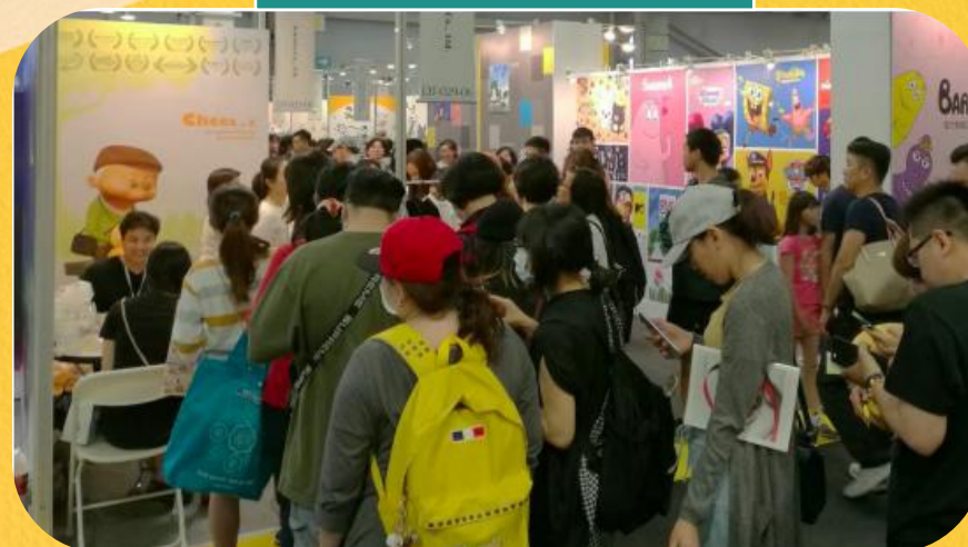
作者见面会，人气高