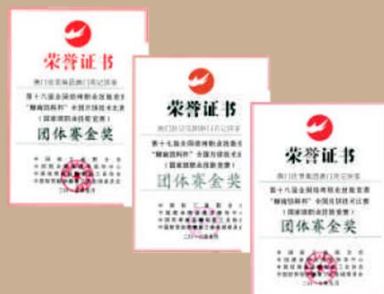
「双黄白莲蓉月饼」连续三年荣获 全国月饼大赛金奖